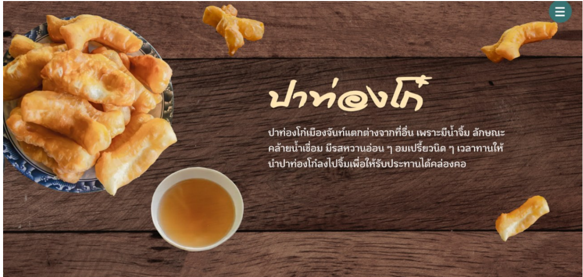
รูปที่ ค.8 ตัวอย่างเนื้อหาในเว็บไซต์ (รูปที่ 3)