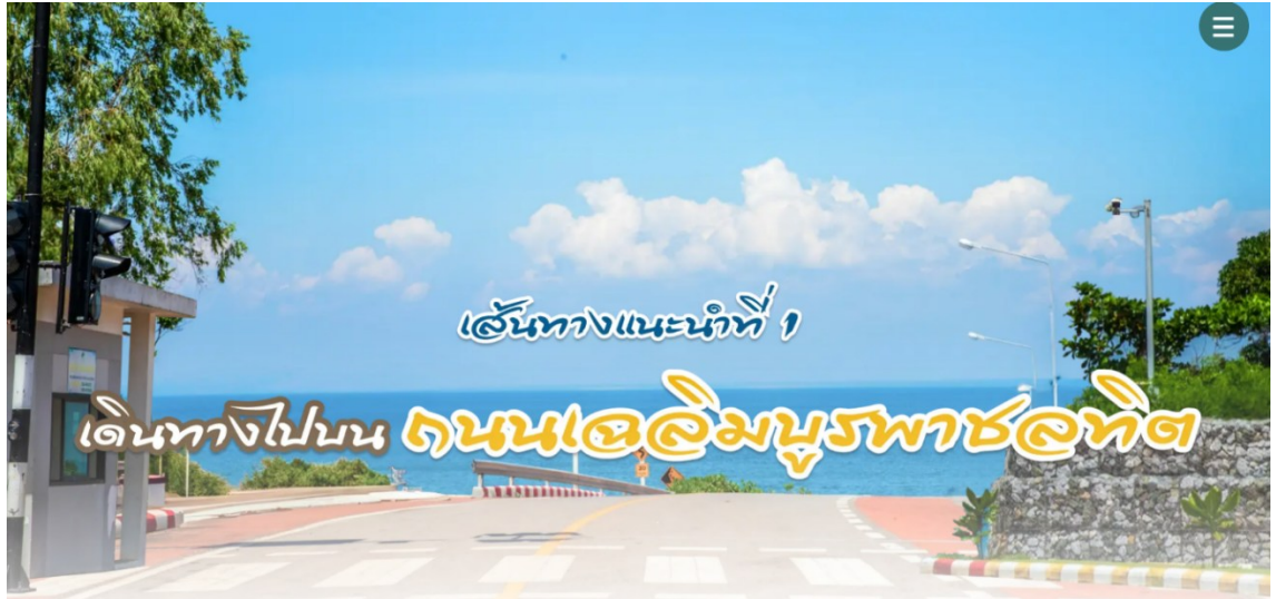
รูปที่ ค.16 ตัวอย่างเนื้อหาในเว็บไซต์ (รูปที่ 10)