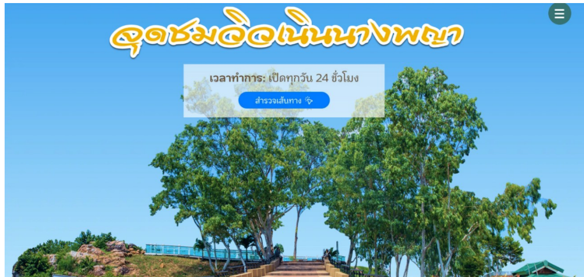
รูปที่ ค.19 ตัวอย่างเนื้อหาในเว็บไซต์ (รูปที่ 13)