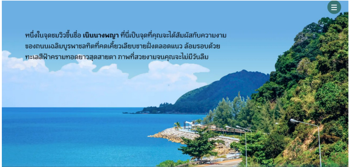
รูปที่ ค.18 ตัวอย่างเนื้อหาในเว็บไซต์ (รูปที่ 12)