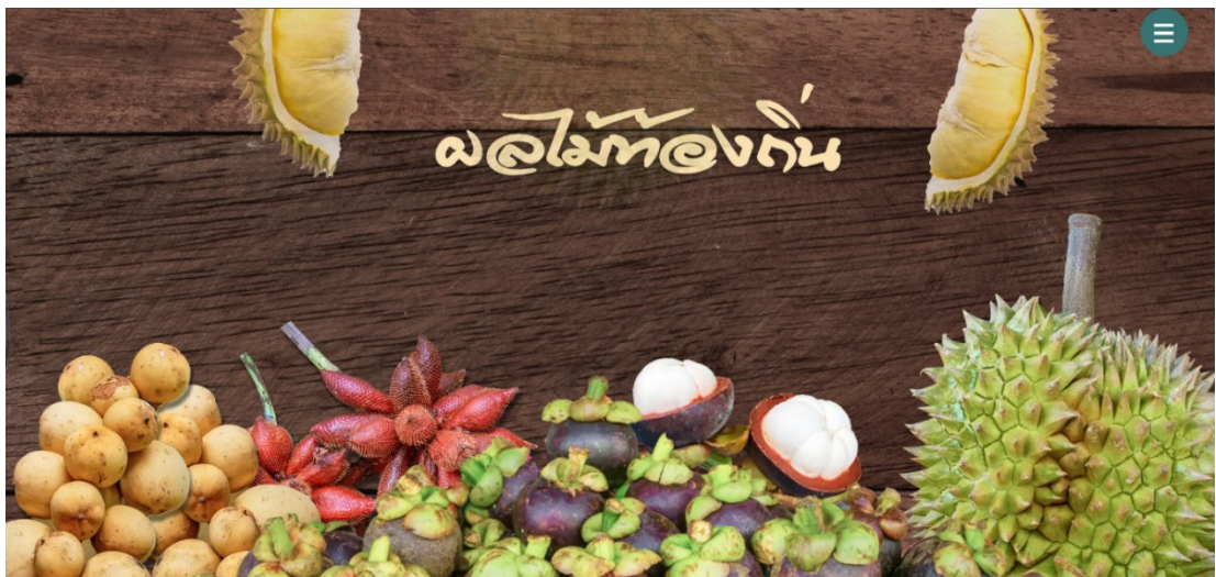
รูปที่ ค.9 ตัวอย่างเนื้อหาในเว็บไซต์ (รูปที่ 4)