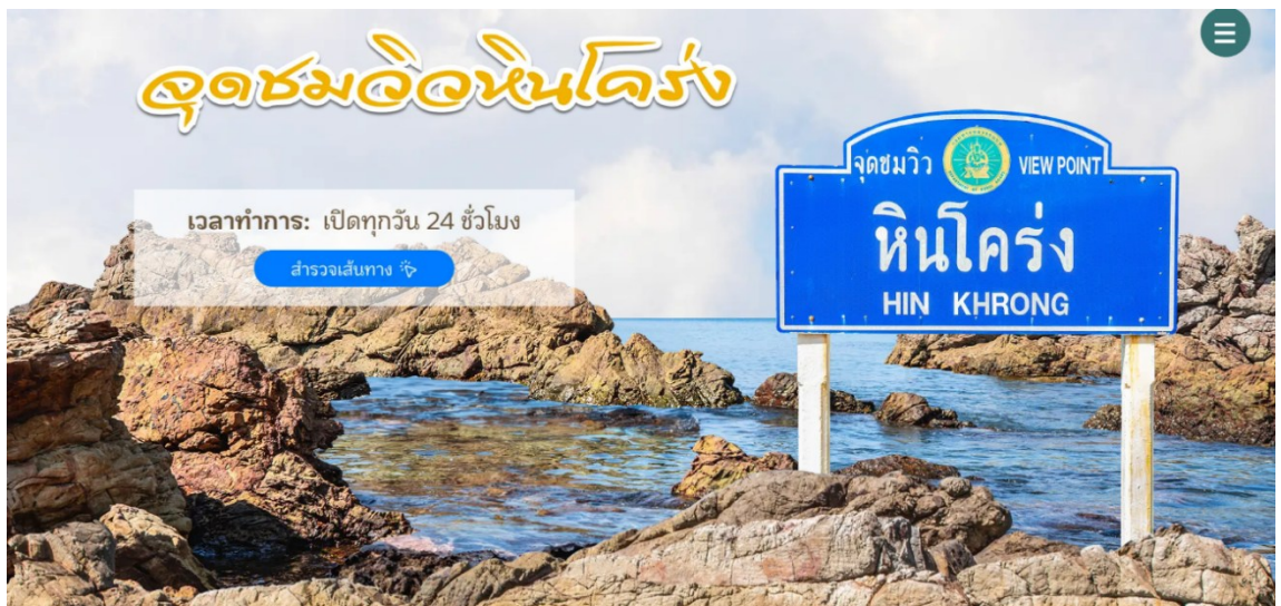
รูปที่ ค.17 ตัวอย่างเนื้อหาในเว็บไซต์ (รูปที่ 11)